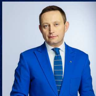
PAWEŁ RABIEJ PRZEWODNICZĄCY NOWOCZESNEJ W WARSZAWIE, CZŁONEK ZARZĄDU PARTII

Chcemy, by zdrowie stało się publicznym priorytetem, z konieczną przebudową systemu i wzmocnieniem profilaktyki i wczesnego wykrywania chorób. System zdrowia musi działać sprawniej, zapewniając szybki dostęp do diagnostyki i leczenia każdemu – od najmłodszych do najstarszych.