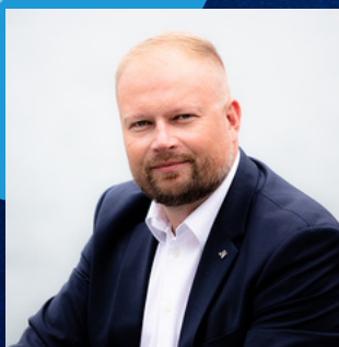
WITOLD ZEMBACZYŃSKI POSEŁ, WICEPRZEWODNICZĄCY NOWOCZESNEJ

"Fundament nowoczesnej i bezpiecznej przyszłości Polski musi opierać się na trzech filarach. Pierwszy to bogate, wykształcone i świadome swojej wartości społeczeństwo. Drugi filar to zintegrowany w ramach wspólnoty transatlantyckiej system sojuszy obronnych poparty silnymi więzami gospodarczymi z partnerami Unii Europejskiej. Trzeci filar to rozwój stosunków bilateralnych z krajami o wspólnych wartościach."