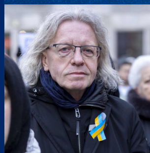
KRZYSZTOF MIESZKOWSKI POSEŁ, CZŁONEK ZARZĄDU NOWOCZESNEJ

"Prawo do aborcji. Prawa kobiet. Prawa mniejszości seksualnych. Prawa człowieka. To nie są tematy zastępcze. Trzeba to w końcu sobie uświadomić."